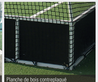
Planche de bois contreplaqué