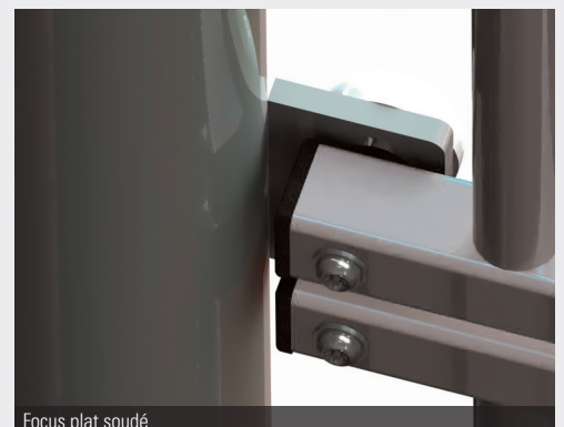
Focus plat soudé