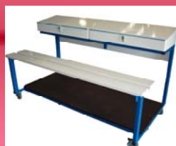
Table de marque