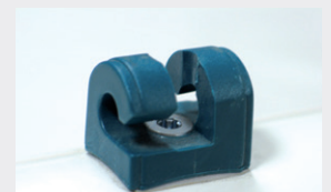
Crochet façade acier