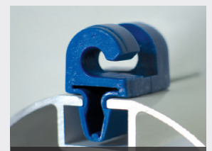
Crochet façade aluminium